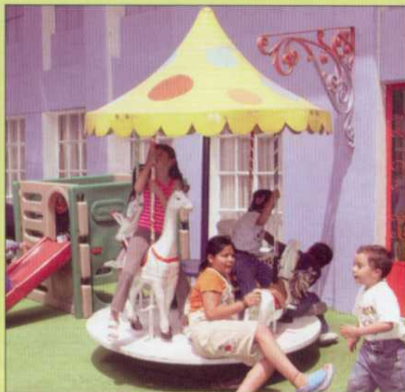
Niños durante las actividades recreativas, en el Programa Infantil de Primavera 2005.

Los infantes fueron atendidos por educadoras especializadas que organizaron diversas actividades didácticas y recreativas, tales como: