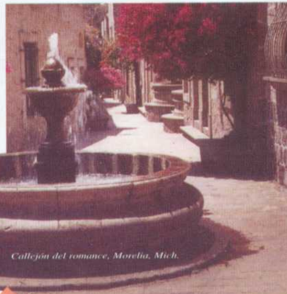
Callejón del romance, Morelia, Mich.