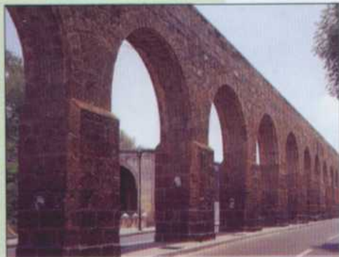
Acueducto de Morelia, Mich.

La ciudad de Morelia en sí es un museo, pero es interesante visitar los que existen en ella; es obligada la visita al Colegio de San Nicolás, al Palacio Clavijero, a la Casa Natal de Morelos, para no citar más que unos cuantos de los muchos recintos de historia de Morelia, ciudad de cantera rosa, de arcadas y camelias, crepúsculos majestuosos, a sólo 3 horas de la capital de México. Sus calzadas, torres y patios interiores son de gran belleza artística y sitúan al viajero en otros tiempos, pero con aromas frescos; todo está intacto a través de los siglos. En los portales del