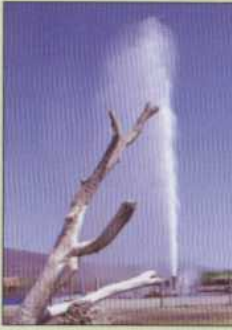
Ixtlán de los Hervores.