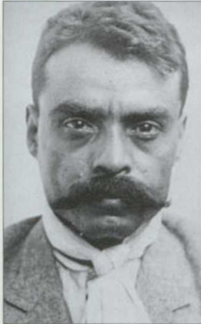
Zapata, querido por los campesinos y odiado por los hacendados.

"Sin ocultar su disgusto, Zapata dio un paso atrás y golpeando al suelo fuertemente con su carabina, en tono respetuoso, pero con la voz un tanto alterada, pues lo oyeron los presentes, dijo: señor Madero, yo no entré a la Revolución para hacerme hacendado; si valgo algo, es por la confianza que en mí han depositado los rancheros, que tienen fe en nosotros,