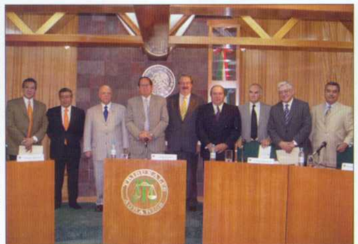
Presidium del evento.

Los integrantes del presidium elogiaron ampliamente la obra del doctor Díaz de León, en comentarios que abarcaron desde los aspectos doctrinarios, hasta los sociales y económicos. ▲