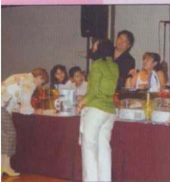
Entrega de regalos.