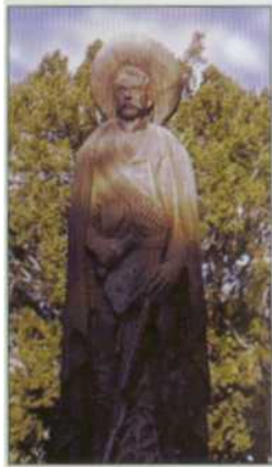
En Cuautla, Mor., debajo de esta escultura, se encuentran los restos de Zapata.

El pensamiento de Emiliano Zapata queda resumido en el siguiente fragmento de su manifiesto a la nación del 20 de octubre de 1913: "...téngase pues presente, que no buscamos el derrocamiento del actual gobierno para asaltar los puestos públicos y saquear los tesoros nacionales, como ha venido sucediendo con los impostores que lograron encumbrar a las primeras magistraturas; sépase de una vez por todas, que no luchamos contra Huerta únicamente, sino contra todos los gobernantes y los conservadores enemigos de la hueste reformista, y sobre todo recuérdese siempre que no buscamos honores, que no anhelamos recompensas, que vamos sencillamente a cumplir el compromiso solemne que hemos contraído dando pan a los desheredados y una patria libre, tranquila y civilizada a las generaciones del porvenir". ▲