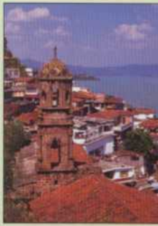
Isla de Janitzio.

Michoacán, tiene una amplia oferta de atractivos turísticos, naturales y culturales, en sus más altas expresiones. ▲