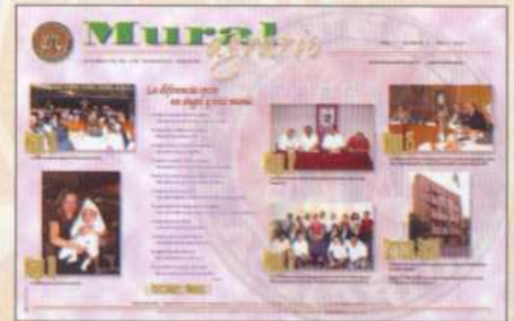
Periódico Mural de mayo 2005.

La política editorial del Mural Agrario busca un equilibrio entre el quehacer institucional y las actividades