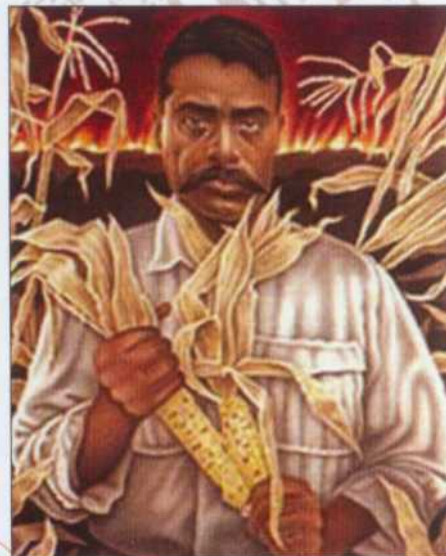
Emiliano Zapata, padre del agrarismo mexicano.