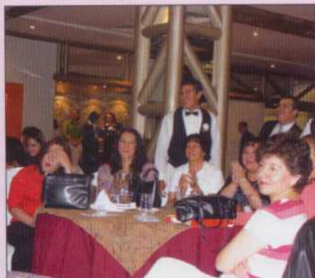
Mamás durante el festejo.

Durante el festejo, hubo una rifa en la que se entregaron diferentes regalos entre las presentes, lo que motivó