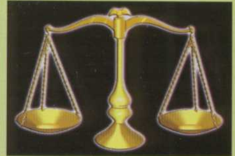
Imparcialidad y justicia pilares del Derecho.

La Dirección General Jurídica consta de 5 direcciones de área, lo cual le da una gran fluidez a los diversos asuntos que tienen que ser resueltos.