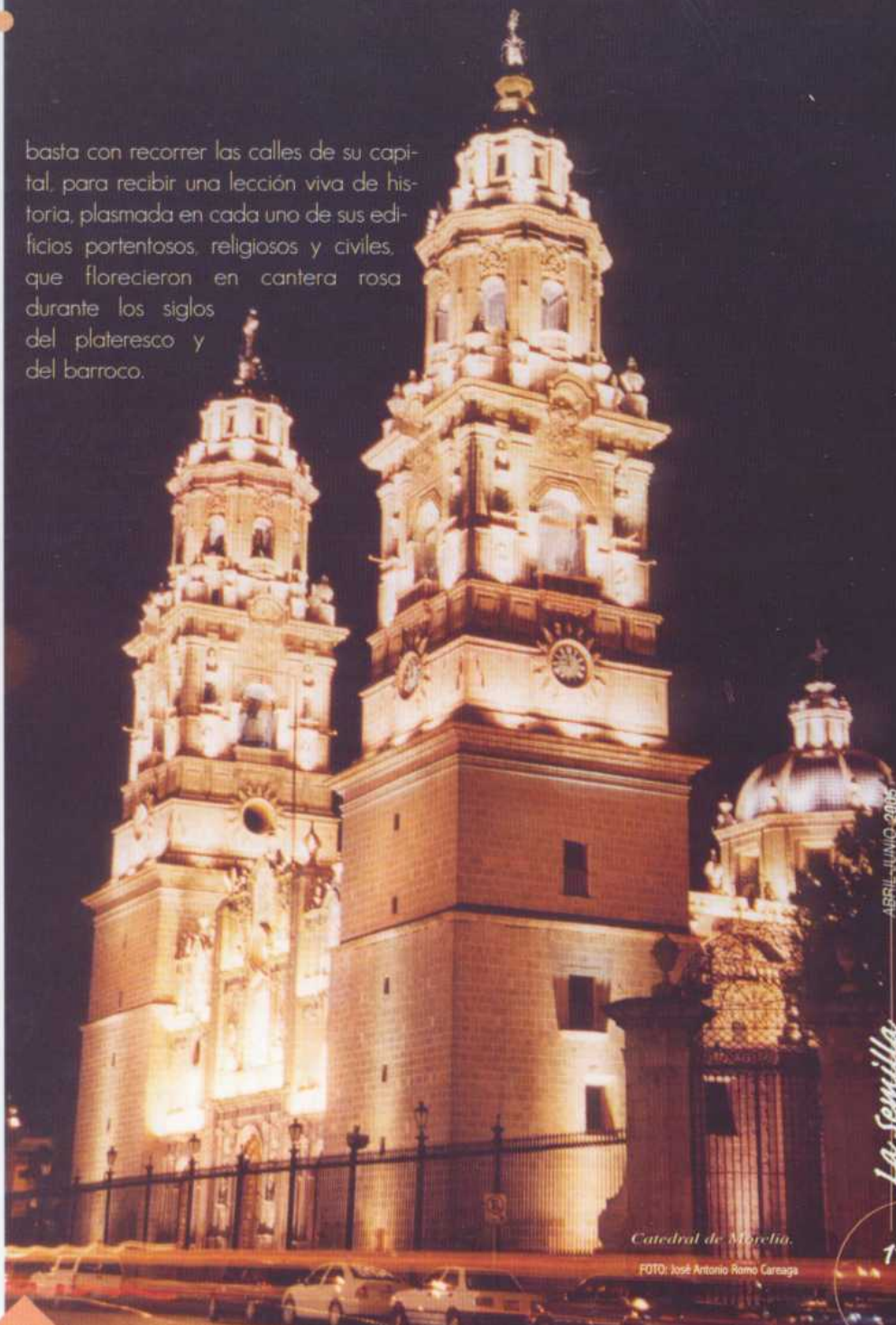
Catedral de Morelia.

basta con recorrer las calles de su capital, para recibir una lección viva de historia, plasmada en cada uno de sus edificios portentosos, religiosos y civiles, que florecieron en cantera rosa durante los siglos del plateresco y del barroco.