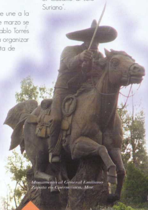
Monumento al General Emiliano Zapata en Cuernavaca, Mor.

"-le ofrezco ir a estudiar detenidamente el caso de Morelos para resolverlo con apego a la justicia-. Y en atención a los servicios que ha prestado usted a la Revolución, voy a procurar que se le gratifique convenientemente de manera que pueda adquirir un buen rancho- dijo el Caudillo al Jefe Suriano".