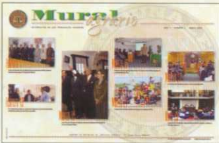
Periódico Mural de abril 2005.

que realiza el propio personal, incluso llegando en un futuro, a proporcionar un espacio para que sus lectores aporten sus creaciones literarias y artísticas. ▲