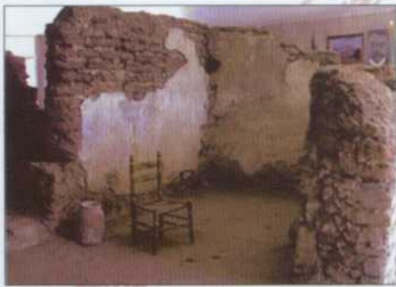
Casa natal de Emiliano Zapata (Anenecuilco), convertida actualmente en museo.

El agrarismo en México, no se puede entender sin Zapata. Su entrañable amor por la tierra y su odio por aquéllos que despojaron a los pueblos morelenses, hacen que Emiliano llegue a convertirse en un símbolo y en un mito en los campos de la región. Así, su primera participación política la hace formando parte del club Melchor Ocampo en Villa de Ayala, en 1909.