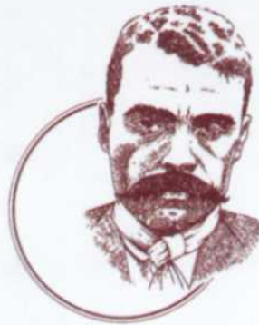
General Emiliano Zapata.