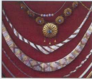
Trabajos realizados en Huetamo, Mich.

• Maravatio, Ciudad Hidalgo y Los Azufres, perlas entre la naturaleza verde de las altas montañas de Mil Cumbres. Entorno de magníficas coníferas, escogido por la Mariposa Monarca para hibernar.