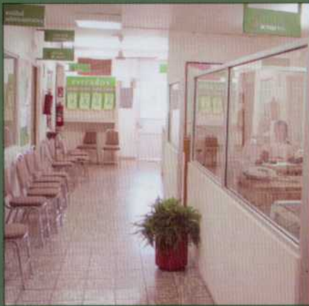
Oficinas del Tribunal Unitario Agrario del Distrito 35, Ciudad Obregón, Son.