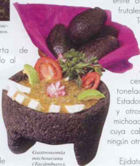
Gastronomía michoacana (Tacámbaro).

La intensa vida cultural en todas sus ciudades y poblaciones propicia el florecimiento de todas las artes, las artesanías y la música de los pueblos