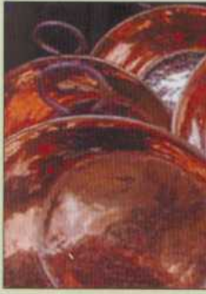
Santa Clara del Cobre.