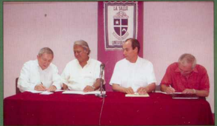
Firma de convenio con la Universidad La Salle, campus Noroeste.

Dicho Convenio señala el compromiso del personal profesional y alumnado que presta su servicio en el Bufete Jurídico de la Universidad, para proporcionar asesoría y gestión legal gratuita a campesinos que lo requieran y carezcan de recursos económicos para cubrir los honorarios de un abogado.