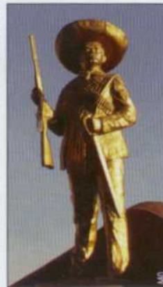
La figura de Zapata es muy recordada en el país.

La primera acción importante de guerra de Emiliano Zapata, fue la toma de la ciudad de Cuautla, Mor., principal bastión de los hacendados de la época.