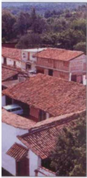
techos de teja roja, son característica de los pueblos michoacanos.

• Ixtlán de los Hervores, con sus famosos géiser.