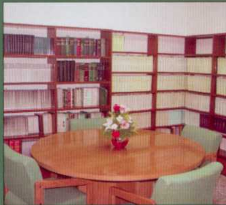
Biblioteca del T.U.A. 35, Ciudad Obregón, Son.