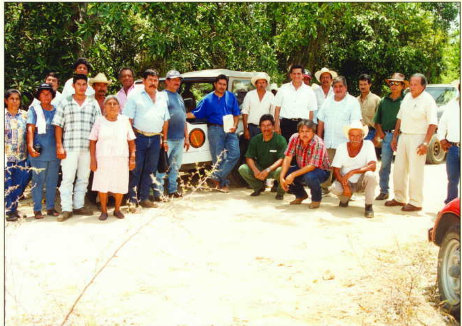
Campeños y actuario ejecutor.

"NOTIFICACIONES. LEGALIDAD DE LAS. EL ACTUARIO TIENE FE PÚBLICA POR ACTUAR COMO