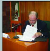
Firma de Convenio con