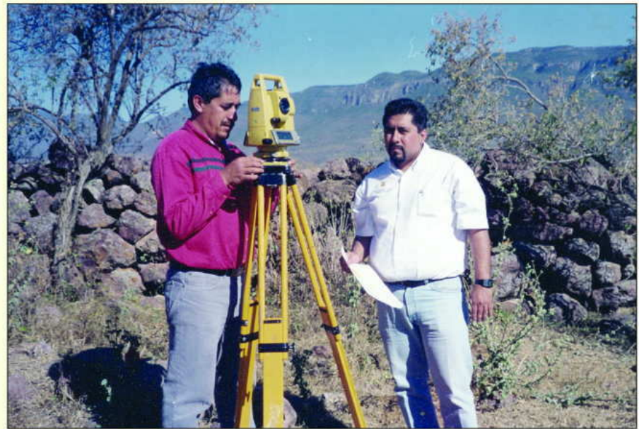
Durante la ejecución.

El fundamento legal de las facultades de los actuarios se encuentran en diversos preceptos de la ley sustantiva y adjetiva, en razón a la facultad de mando, específicamente el artículo 67 del Código Federal de Procedimientos Civiles prevé: