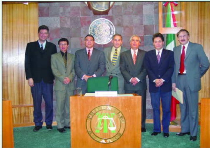
Grupo de expositores.

Internacionales, resaltó que nuestro país, al haber suscrito diversos convenios y tratados- que tienen carácter de ley- está obligado a instrumentar las acciones que en materia ambiental se contemplan en cada uno de esos instrumentos jurídicos. Mencionó que en la actualidad se están buscando los instrumentos económicos que permitan dar certeza a la parte que invierte en nuestro país, a fin de que sea competitiva a nivel internacional.