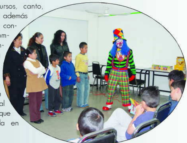
Payaso para los niños.

Las madres de los pequeños agradecieron este apoyo del Tribunal Superior Agrario, ya que ello -dijeron- redundará en beneficio familiar.