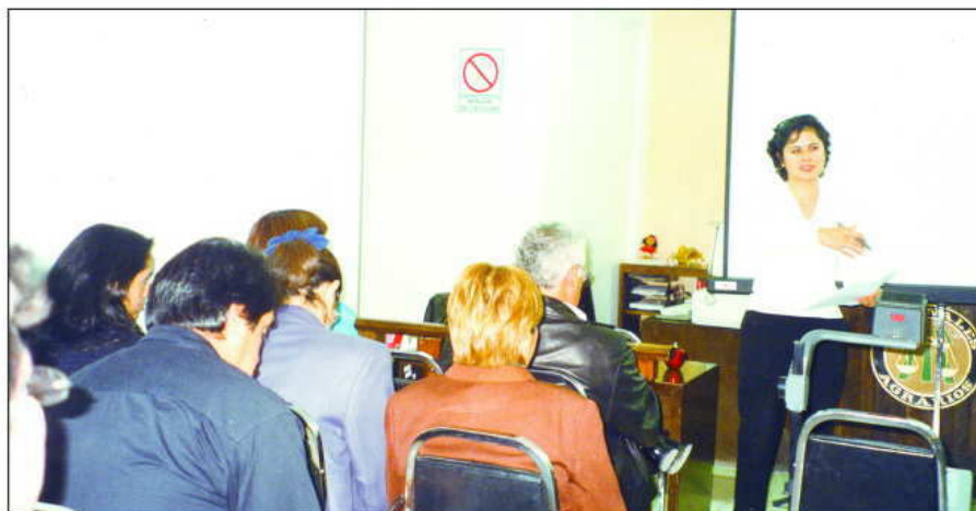
Durante el curso efectuado en el Tribunal Unitario Agrario del distrito 29 (Villahermosa, Tab.), del 11 al 25 de febrero de 2004.

Cabe destacar la valiosa colaboración de los servidores públicos de los Tribunales Unitarios Agrarios que participaron como capacitadores de sus propios compañeros de trabajo.