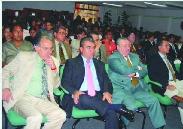
Los asistentes escuchan con atención.

Se pronunció a favor de "formular un análisis de la juricidad que maneja a los recursos naturales; establecer con precisión y claridad la vinculación entre el Derecho Agrario y el Derecho Ambiental y en consecuencia dotar a los Tribunales Agrarios de jurisdicción sobre los temas ambientales".