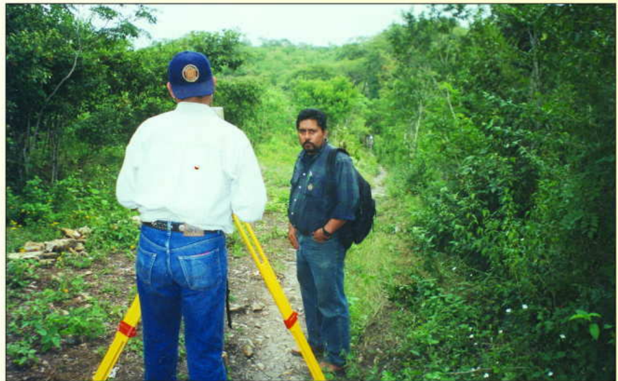
En trabajo de campo.

Artículo 23.- Los actuarios deberán tener título de licenciado en Derecho legalmente expedido por autoridad competente.