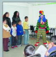
Semana de la Salud y atención a niños