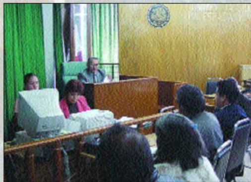
La audiencia, necesaria para escuchar a las partes.

“Me es muy grato trabajar en los Tribunales Agrarios porque para mí es profundamente satisfactorio impartir justicia y solucionar conflictos, a través de la conciliación y de sentencias claras, debidamente motivadas y fundadas, y viables en su ejecución; por ello, en la Magistratura he encontrado el más alto grado de autorrealización de mi vocación de servicio público”.