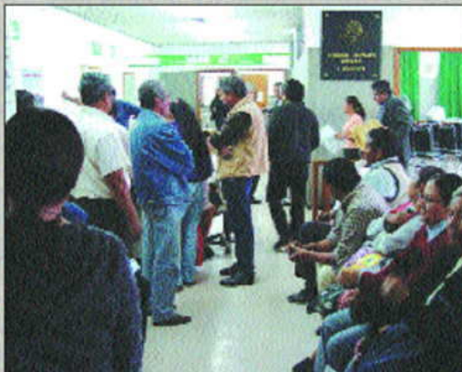
Atención a los campesinos en el Tribunal Unitario Agrario del Distrito 10.

Además, los Magistrados Agrarios tenemos una importante y trascendente responsabilidad y carácter, que nos confiere la Ley Agraria en su artículo 189: dictar sentencias a verdad sabida y en conciencia, motivando y fundando sus resoluciones.