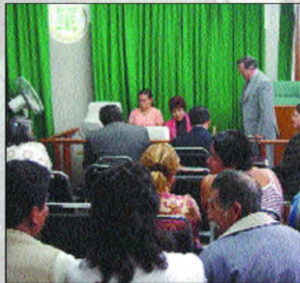
Audiencia en el Tribunal Unitario Agrario del Distrito 10.

Nuestro entrevistado considera que los Tribunales Agrarios han cumplido con la función para lo cual fueron creados y catalogó como exi-