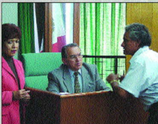
La atención a campesinos, prioritaria.