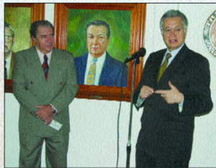
Magistrado Díaz de León y Senador Bartlet.

humanos, las garantías sociales, la parte orgánica del texto político y, desde luego, se complementa con el punto de vista espontáneo de los Magistrados y Senadores, lo que permite obtener el mejor conocimiento y experiencia de estos órganos de gobierno, lo que puede traducirse en iniciativas o, aún, en la elaboración de normas jurídicas que permitan al Senado elaborar mejores leyes, así como una importante motivación en el funcionamiento de los Órganos Jurisdiccionales.