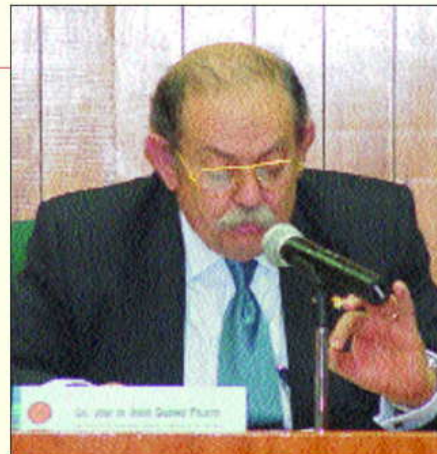
Ministro José de Jesús Gudiño Pelayo.

problemática agraria en México, a la que el derecho agrario pretende regular y aportar soluciones justas para todos los protagonistas, lo cual resultó en un libro de invaluable utilidad para los estudiosos del Derecho Agrario.