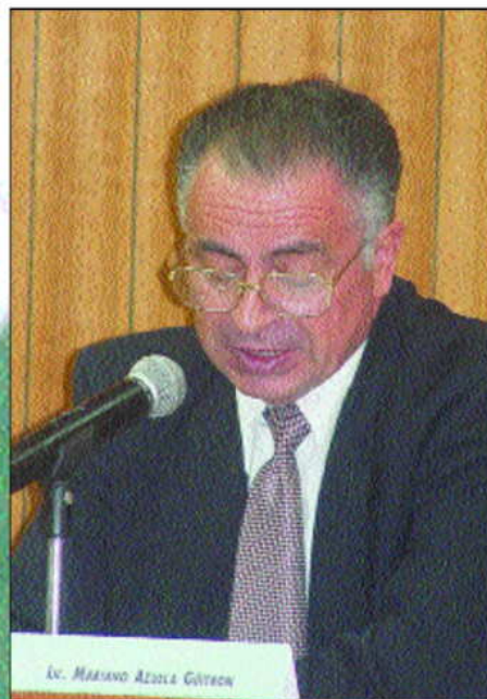
Lic. Mariano Azuela Güitrón.

TAMBIÉN PARTICIPARON LOS MINISTROS GUDIÑO PELAYO Y AGUIRRE ANGUIANO.