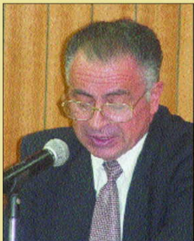
LIC. MARIANO AZUELA GÜITRÓN

PRESIDENTE DE LA SUPREMA CORTE DE JUSTICIA DE LA NACIÓN