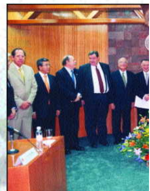
Al término del evento Ministros y funcionarios del Tribunal Superior Agrario.