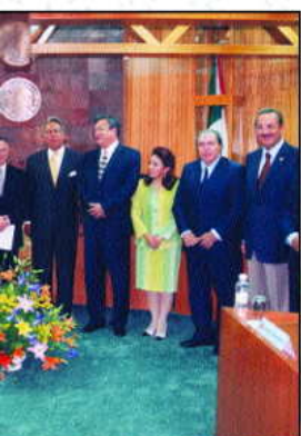
stros de la S.C.J.N. y fun- al Superior Agrario.

campo mexicano, que a pesar de la reivindicación buscada por el Derecho