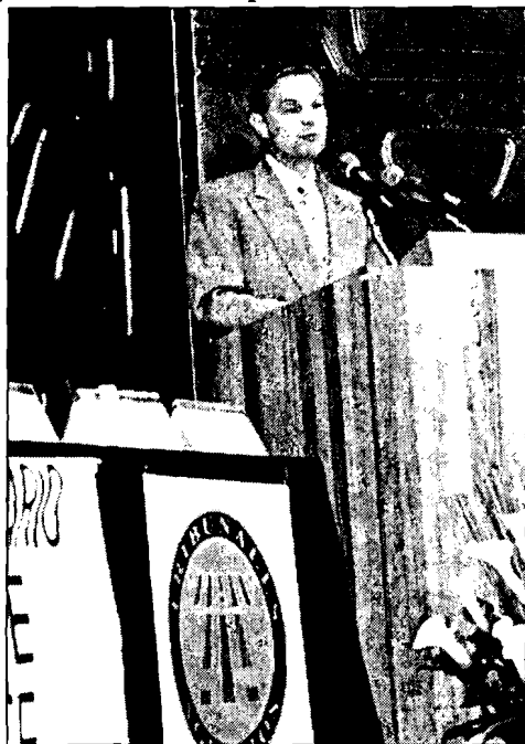
El Lic. Luis Ernesto Derbez Bautista inauguró el Simposium.