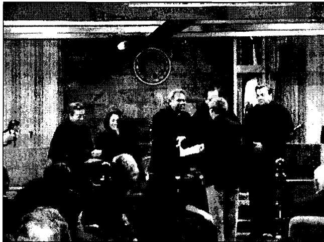
Entrega de medallas y reconocimientos al personal con 10 años de servicio en la institución, durante la ceremonia del Décimo Aniversario de los Tribunales Agrarios.