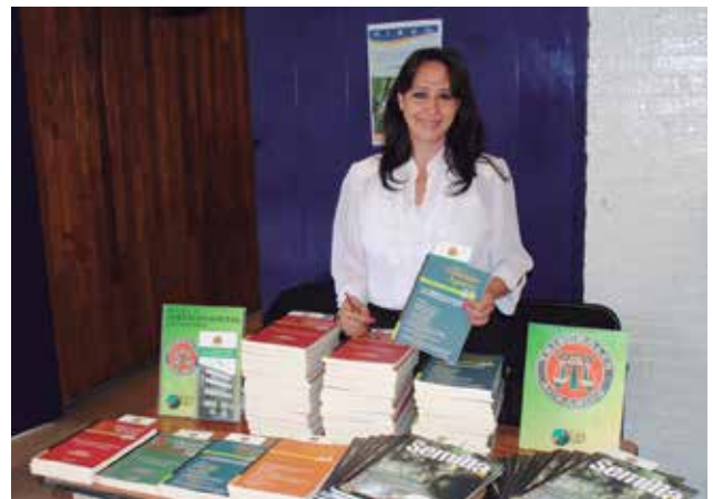
Promoción de publicaciones