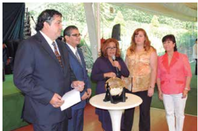
Rifa de obsequios