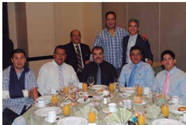
Asistentes al evento