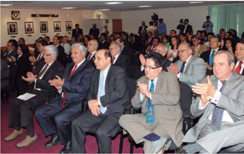
Asistentes a la presentación del libro "Código Federal de Procedimientos Civiles con comentarios"

De esta obra, destaca la importancia del Código Federal de Procedimientos Civiles que da sustento a las principales instituciones jurídicas de nuestro país, como el Amparo y la Ley Agraria y a su vez, permite dar certeza jurídica, preservar la paz y la justicia en la República Mexicana.