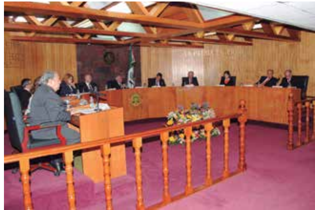
Presidium del evento