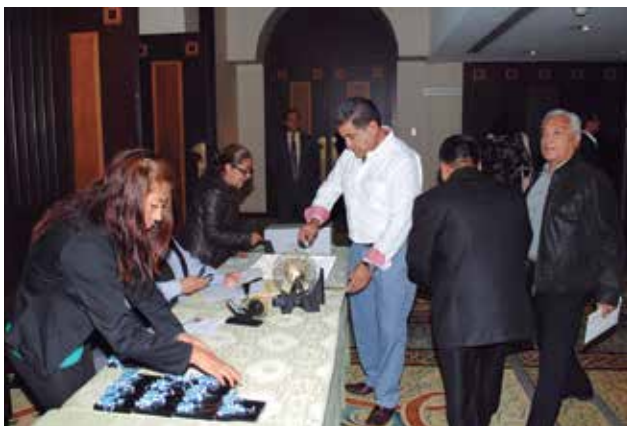
Sorteo del evento