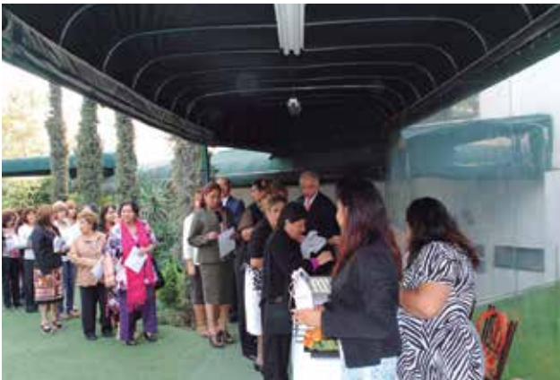
Arribo de los invitados