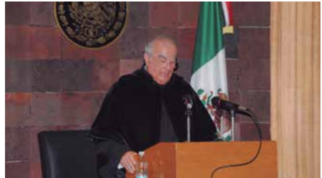
Magistrado Presidente del Tribunal Superior Agrario Lic. Marco Vinicio Martínez Guerrero

Señaló la labor realizada en materia de capacitación de los servidores públicos jurisdiccionales y administrativos de los Tribunales Agrarios, lo cual implica una mejora