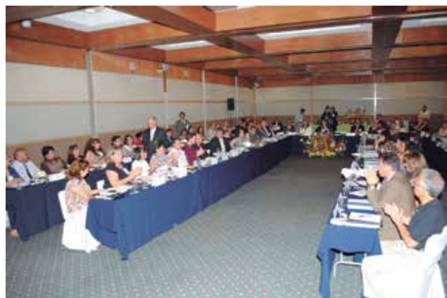
Reunión de trabajo