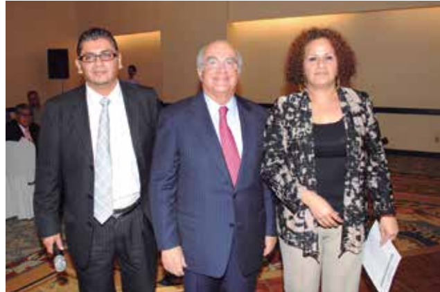
Magistrado Presidente Lic. Marco Vinicio Martínez Guerrero acompañado de los representantes sindicales de los Tribunales Agrarios

Con motivo de la celebración del Día del Padre, el Tribunal Superior Agrario, en conjunto con el Sindicato Nacional de Trabajadores de los Tribunales Agrarios (S.N.T.T.A.) y el Sindicato Democrático de Trabajadores del Tribunal Superior, Agrario (S.D.T.T.S.A.), ofreció a los servidores públicos que son padres, un ameno desayuno, para festejar su día.