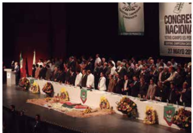
Presidium del evento