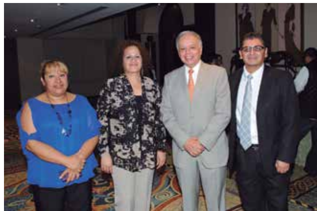
El Oficial Mayor acompañado de representantes sindicales