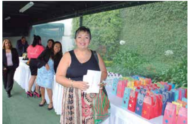
Asistente al evento

El día 9 de mayo de 2013 se llevó a cabo el festejo del Día de las Madres para las servidoras públicas que laboran en el TSA. El evento fue realizado por el Tribunal Superior Agrario en colaboración con el Sindicato Nacional de Trabajadores de los Tribunales Agrarios (S.N.T.T.A.) y el Sindicato Democrático de Trabajadores del Tribunal Superior Agrario (S.D.T.T.S.A.).