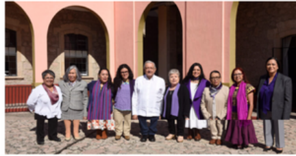
Presidente y funcionarias del Gabinete de la Cuarta Transformación conmemoran Día Internacional de las Mujeres

2024: Año de Felipe Carrillo Puerto, benemérito del proletariado, revolucionario y defensor del Mayab