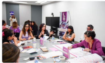
Mesas de reflexión 'Las Mujeres y el Desarrollo Territorial'

Secretaría de Desarrollo Agrario, Territorial y Urbano | 08 de marzo de 2024 | Comunicado