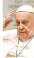
En una entrevista, Francisco consideró que Ucrania debería "izar la bandera blanca".

"Le doy las gracias a los capellanes ucranianos que están con el ejército con las Fuerzas de Defensa. Están en el frente, protegiendo la vida y la humanidad y apoyando con sus oraciones, palabras y actos. Eso es lo que hace la iglesia, estar con la gente, no en algún lugar a dos mil 500 kilómetros, mediando virtualmente entre quien quiere vivir y quien quiere destruirnos", afirmó Zelenski. Por su parte, el ministro de Asuntos Exteriores de Ucrania, Dmítrí Kuleba, dijo al Vaticano que presta especial atención a su papel en la Segunda Guerra Mundial, en respuesta al llamamiento de Francisco a mostrar "el coraje de izar la bandera blanca".