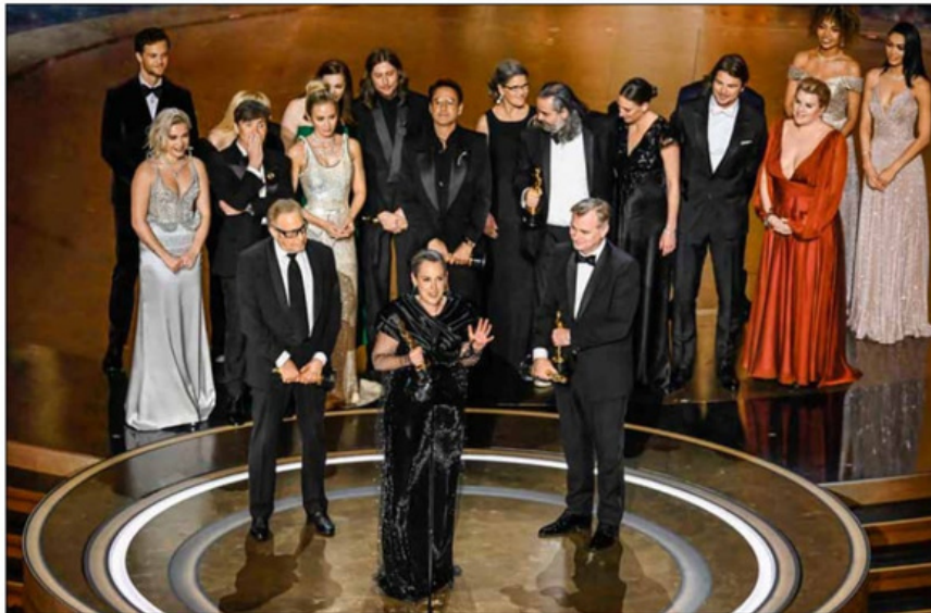
▲ Los productores Emma Thomas y Charles Roven (centro e izquierda), así como el director de la película premiada, Christopher Nolan, recibieron la estatuilla dorada en la ceremonia realizada en el Teatro Dolby, en Los Ángeles. El filme también obtuvo el galardón