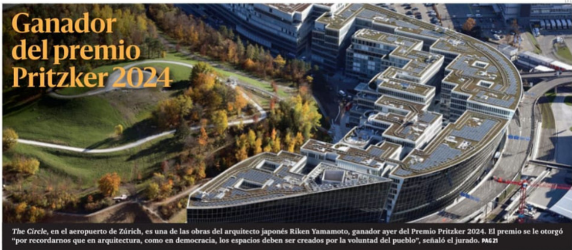
The Circle, en el aeropuerto de Zúrich, es una de las obras del arquitecto japonés Riken Yamamoto, ganador ayer del Premio Pritzker 2024. El premio se le otorgó "por recordarnos que en arquitectura, como en democracia, los espacios deben ser creados por la voluntad del pueblo", señaló el jurado. PÁG 21