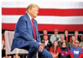
El mandatario enfrenta diversos juicios penales y civiles que amenazan su camino a un segundo mandato.