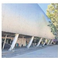
Las Escuelas de las escuelas se encuentran en mal estado, debido a la falta de mantenimiento.

A este respecto, que para estudiantes, trabajadores y especialistas impacta en la infraestructura y desarrollo académico, se manifiesta la desaparición del fideicomiso que sirvió para su construcción. | CULTURA | A30