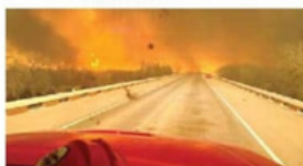
ZONAS CRÍTICAS, EL NORTE Y EL ESTE