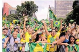
Miles de partidarios del expresidente ultraconservador de Brasil, Jair Bolsonaro, lo respaldaron en un mitin multitudinario.

El exmandatario de extrema derecha, que llamó a la manifestación después de haber sido objeto de una redada policial este mes como parte de una investigación sobre un presunto intento de golpe de Estado, habló por alrededor de 20 minutos para defenderse y recordaba su periodo entre 2019 y 2022. Se abstuvo de atacar a viejos enemigos y al Supremo Tribunal Federal. Los