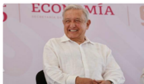
Exportadora de Sal queda a salvo de privatizaciones. Hoy es patrimonio de los mexicanos: presidente

Presidencia de la República | 24 de febrero de 2024 | Comunicado