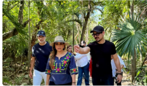
Mara Lezama y Román Méyer supervisan Parque del jaguar para su próxima apertura

Secretaría de Desarrollo Agrario, Territorial y Urbano | 24 de febrero de 2024 | Comunicado