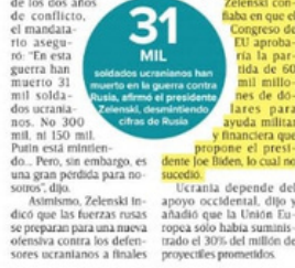
Tras cumplirse dos años de guerra entre Ucrania y Rusia el pasado sábado, Zelenski dio una conferencia de dos horas.

Ucrania depende del apoyo occidental, dijo y añadió que la Unión Europea solo había suministrado el 30% del millón de proyectos prometidos.