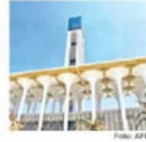
La biblioteca de la mezquita albergará un millón de libros.

china después de que años de agitación política transformaron el proyecto de un símbolo de fuerza y religiosidad patrocinado por el Estado a uno de retrasos y sobrecostos que ascenden