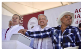
Presidente AMLO entrega Acueducto Yaqui en marzo se consolida suministro para 34 mil habitantes

Presidencia de la República | 25 de febrero de 2024 | Comunicado