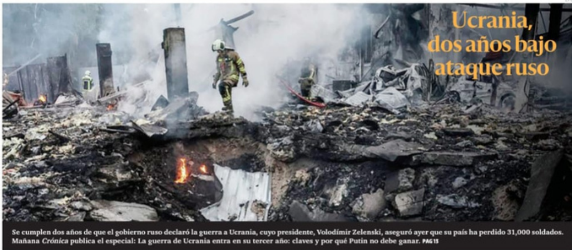
Se cumplen dos años de que el gobierno ruso declaró la guerra a Ucrania, cuyo presidente, Volodímir Zelenski, aseguró ayer que su país ha perdido 31,000 soldados. Mañana Crónica publica el especial: La guerra de Ucrania entra en su tercer año: claves y por qué Putin no debe ganar. PÁG 13