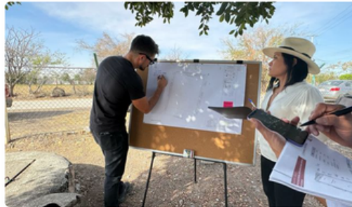
El titular de la Sedatu, Román Meyer Falcón, durante una visita de supervisión por la entidad.

Secretaría de Desarrollo Agrario, Territorial y Urbano | 22 de febrero de 2024 | Comunicado