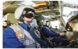
Putin fue retratado al mando de un avión bombardero de la era soviética con capacidad de transportar armas nucleares.

AFP globalgrm.com.mx MOSCU — El presidente de Rusia, Vladimir Putin, aseguró que prefiere al mandatario estadounidense, Joe Biden en la Casa Blanca que al republicano Donald Trump. "Estamos dispuestos a trabajar con cualquier presidente. Pero creo que para nosotros, Biden es un presidente preferible para Rusia, y