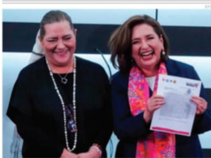
Guadalupe Taddel, presidenta del INE, entregó el registro a Xóchitl Gálvez.

nen grupos criminales para movilizar a la gente, y con esa base se dan el lujo de pactar treguas para frenar enfrentamientos entre ellos, como es el caso entre 'Los Tlacos' y 'Los Ardillos', PÁG 6