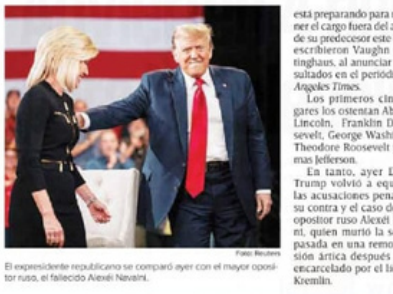
El expresidente republicano se comparó ayer con el mayor opositor ruso, el fallecido Alexéi Navalni.

en la opinión de 154 académicos de todo el país norteamericano. En contraste, el actual mandatario Joe Biden se posicionó en un decésimo lugar, justo por delante de Woodrow Wilson, Ronald Reagan y Ulyses S. Grant. Los logros más importantes de Biden pueden ser que rescató la presidencia de manos de Trump, retornó un estilo más tradicional de liderazgo presidencial y se