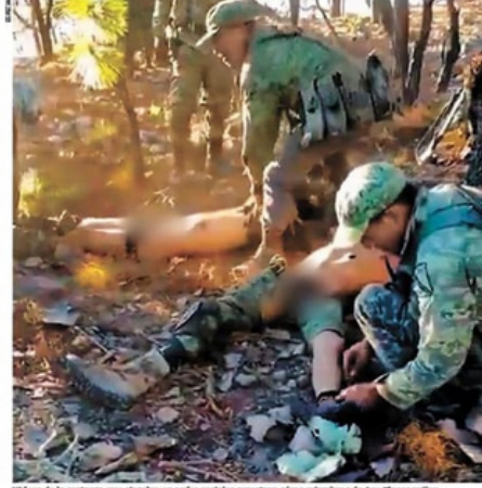
Víctimas de la masacre que circula en redes sociales muestran cómo miembros de Los Tlacos apilan los cadáveres que presentan el tiro de gracia, se burlan, les quitan las botas y les prenden fuego.