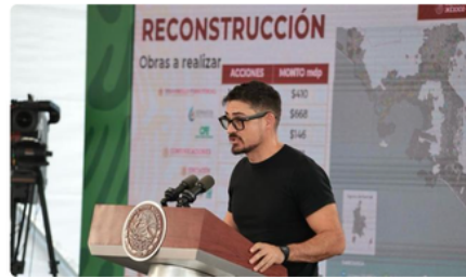
Titular de la Sedatu, Román Meyer Falcón

Secretaría de Desarrollo Agrario, Territorial y Urbano | 15 de febrero de 2024 | Comunicado