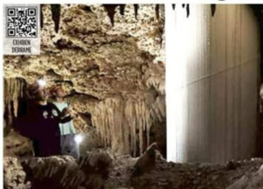
El tramo detenido es donde se encuentran ríos subterráneos y los cenotes que se han perforado para colocar columnas de cemento.

El tribunal ordenó además que el Gobierno entre-