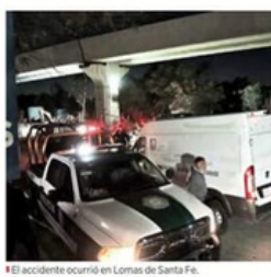
El accidente ocurrió en Lomas de Santa Fe.

"Los trabajadores no tenían amarras ni líneas de vida y no estaba delimitado el espacio. Ni precaución son los señores y los trabajadores de una obra en la que el Gobierno tiene contratada a una empresa absolutamente negligente", dijo tras acudir al lugar del accidente.