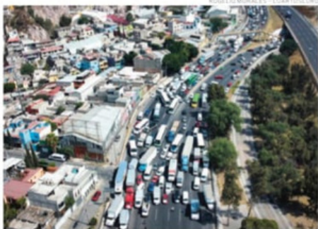
El paro de los transportistas duró cerca de ocho horas.

los doblemente articulados tipo tanque, solicitan tarifas oficiales y emplacamiento por parte de la SICT para vehículos de carga y turismo de modelos atrasados. PÁG 6