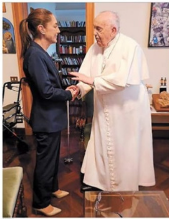
IMAGEN DEL DÍA EL PRIMER ROUND, EN EL VATICANO

Xóchitl Gálvez se reunió con el papa Francisco el pasado martes, aunque por petición de El Vaticano no pudo darlo a conocer hasta ayer. La candidata dijo que el encuentro duró unos 40 minutos y que hablaron de política, la violencia en México y hasta de fútbol. A su vez, Claudia Sheinbaum fue recibida ayer y posteriormente indicó en redes sociales que el pontífice le dio "grandes consejos de vida" y aseguró que se trató de una reunión que nunca olvidará.