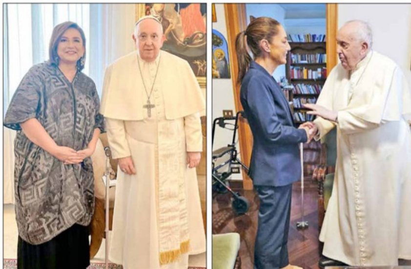
Xóchitl Gálvez, candidata de PAN, PRI y PRD, informó que su cita del martes con el papa Francisco “fue de carácter espiritual” y reafirmó su fe católica. Sostuvo que ella consiguió la audiencia. Claudia Sheinbaum, aspirante de la coalición Sigamos Haciendo Historia, fue