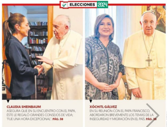
CLAUDIA SHEINBAUM ASEGURA QUE EN SU ENCUENTRO CON EL PAPA, ESTE LE REGALÓ GRANDES CONSEJOS DE VIDA: 'FUE UNA HORA EXCEPCIONAL'. PÁG. 38