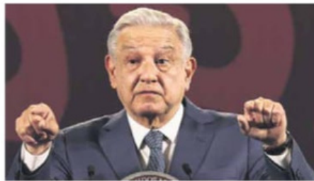
Garantiza abasto. Se trabaja en un plan para que no falte el agua, dijo AMLO