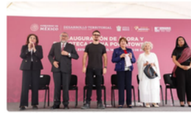
Inauguración Centro Cultural y Biblioteca Elena Poniatowska.

Secretaría de Desarrollo Agrario, Territorial y Urbano | 14 de febrero de 2024 | Comunicado