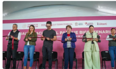
Parque Bicentenario de Ecatepec

Secretaría de Desarrollo Agrario, Territorial y Urbano | 14 de febrero de 2024 | Comunicado