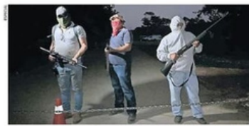
Políticos controlan el paso a Frontera Comisaj, en Chiapas, para protegerse del crimen.