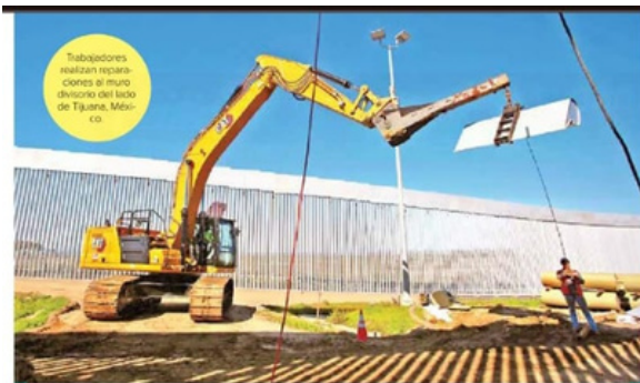
Trabajadores realizan reparaciones al inmueble de inmigrantes del lado de Tijuana, México.