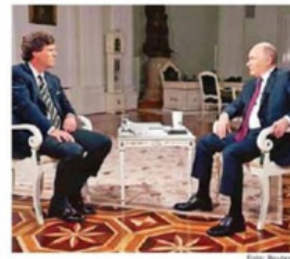
Tucker Carlson (izq.), comunicador ligado a Trump, charló con el líder del Kremlin por casi dos horas.