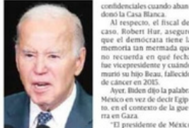
El presidente de EU aseguró que su memoria “está bien”.

El fiscal del caso aseguró que el demócrata no actuó de mala fe, sino que es “un anacrono bien intencionado y con mala memoria”.