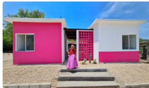
Módulo de indicadores de autoproducción en la plataforma tecnológica del Sistema Nacional de Información e Indicadores de Vivienda (SNIIV)

Secretaría de Desarrollo Agrario, Territorial y Urbano | 08 de febrero de 2024 | Comunicado