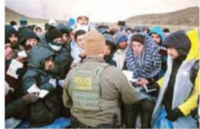
El martes pasado, el Senado de Estados Unidos anuló un acuerdo fronterizo que consideraba el cierre de la frontera con México.

Un día después de que el Senado de ese país rechazó endurecer la política migratoria que incluía cerrar la frontera con México, López Obrador sostuvo que en