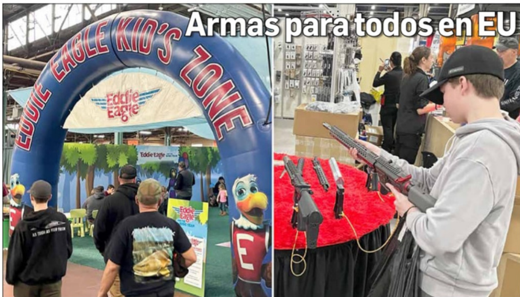
● Organizó la Asociación Nacional del Rifle enorme exposición "recreativa"

VIERNES 9 DE FEBRERO DE 2024 // CIUDAD DE MÉXICO // AÑO 40 // NÚMERO 14211 // Precio 10 pesos