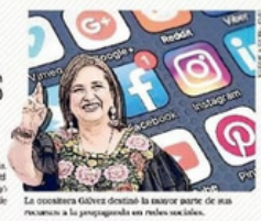
La asesora Gálvez destaca la mayor parte de sus recursos a la propaganda en redes sociales.

En 60 días de precampaña, Claudia Sheinbaum, aspirante de Sigamos Haciendo Historia, desembolsó 38 millones 190 mil pesos. Néstor Cárdenas, de Fuerza y Cambio por México, usó 62 millones 171 mil, y Jorge Álvarez Máynez, de MC, 23 millones de pesos en 10 días. | A8 |