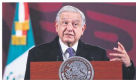
Reciben 800 mil pesos. El pueblo está manteniendo a verdugos en el PJ

también cuestionó que el pueblo tenga que estar pagando el salario de los ministros de la Corte, que con prestaciones ronda los 800 mil pesos. "Es una injusticia, pues no resuelven nada", dijo. —Diana Benítez / PÁG. 31