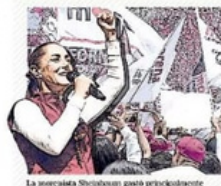
La asesora Sheinbaum avista antecandidato en la organización de eventos estatales y nacionales.

El Guadalupeño hace oficial el retorno del futbolista más importante que ha formado. Su misión es ayudar a ganar el título. | DE |