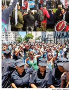
Al menos 600 mil personas participaron en la marcha de Buenos Aires, decenas se sumaron en Ciudad de México (arriba).

Entre los contingentes había integrantes de sindicatos de acieros, periodistas, trabajadores de la cultura, de hospitales, de la ciencia, así como miembros de organizaciones barriales.