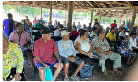
Reunión de trabajo con familias beneficiarias

Secretaría de Desarrollo Agrario, Territorial y Urbano | 23 de enero de 2024 | Comunicado