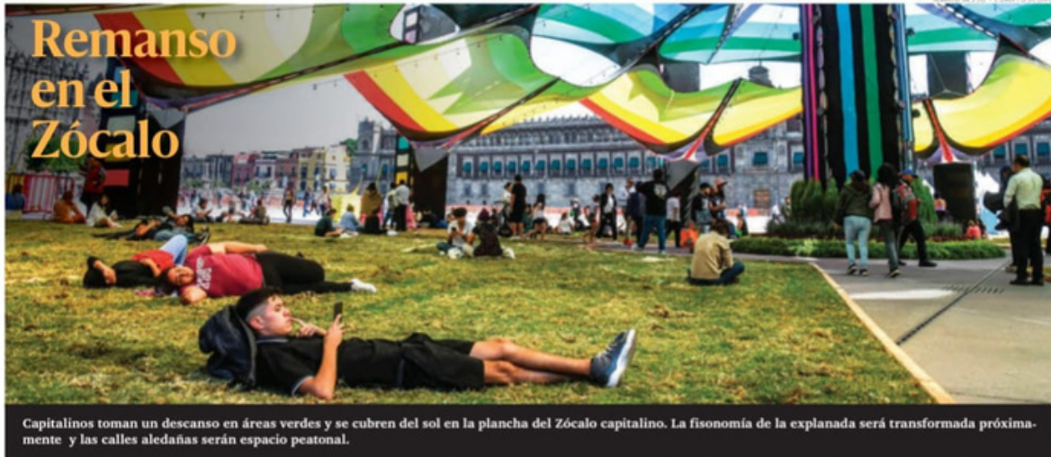
Capitalinos toman un descanso en áreas verdes y se cubren del sol en la plancha del Zócalo capitalino. La fisonomía de la explanada será transformada próximamente y las calles aledañas serán espacio peatonal.

PRESIDENTE DEL CONSEJO DE ADMINISTRACIÓN: JORGE KAHWAGI GASTINE // DIRECTOR GENERAL: RAFAEL GARCÍA GARZA // AÑO 27 N.º 918 $10.00 // MIÉRCOLES 24 ENERO 2024 // WWW.CRONICA.COM.MX