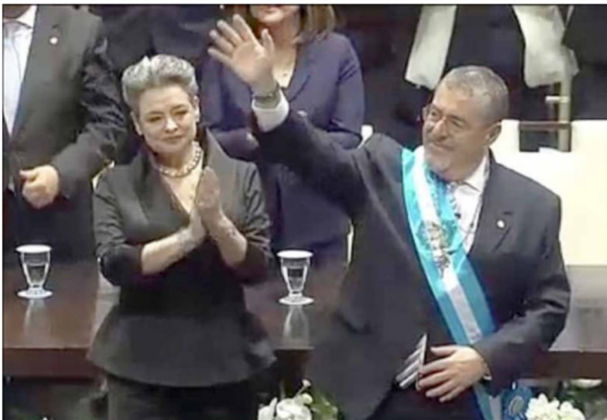
▲ Bernardo Arévalo de León asumió la presidencia de Guatemala para el periodo 2024-2028 con más de ocho horas de retraso debido a las maniobras dilatorias del llamado "pacto de corruptos"