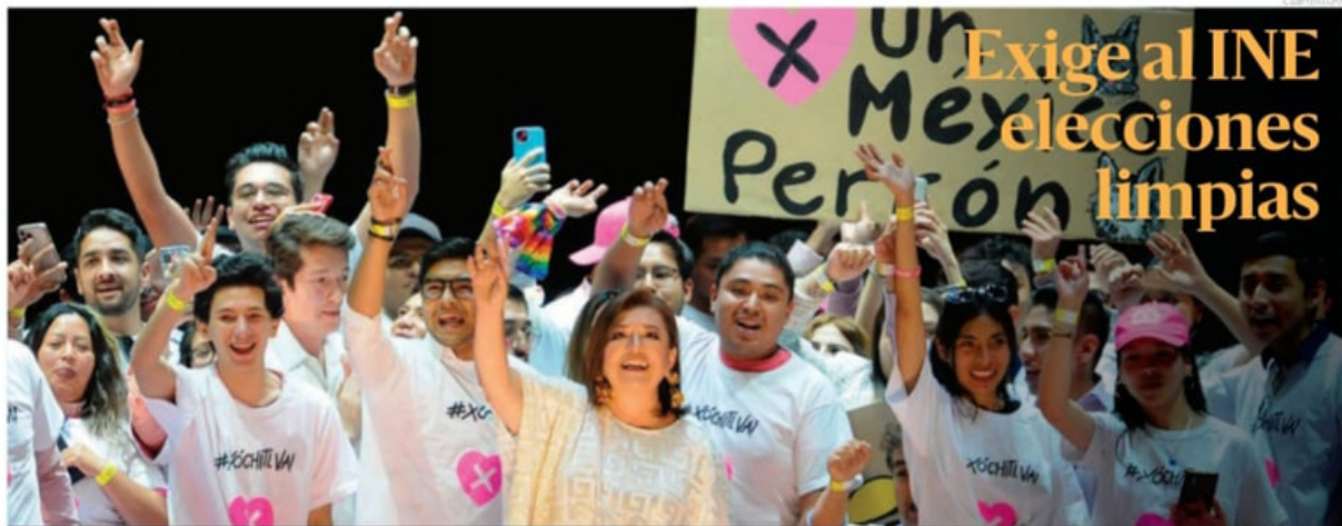
Xóchitl Gálvez estuvo acompañada este domingo por jóvenes durante el cierre de su precampaña en la Ciudad de México. En su discurso demandó al INE y al TEPJF garantizar voto libre y elecciones limpias.