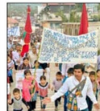
Peregrinación en Sitalá para exigir que se restablezca la paz.