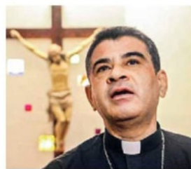
Entre los religiosos expulsados del país sudamericano se encuentran los obispos Rolando Álvarez (foto) e Isidoro Mora.