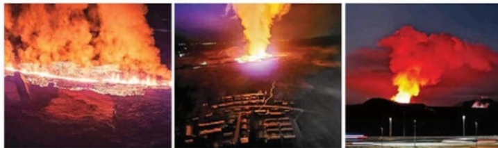
Una grieta de un kilómetro en el volcán de Grindavik, Islandia, generó una erupción que pone en peligro la infraestructura civil; los habitantes ya fueron evacuados.

REIKIAVIK. — La pequeña localidad islandesa de Grindavik volvió a ser evacuada por segunda vez desde noviembre a primera hora de ayer tras una erupción de una grieta de magma que recuerrta a la ocurrida hace dos meses cuando los 4 mil habitantes de la ciudad debieron abandonar sus hogares. La nueva erupción es de una grieta de casi un